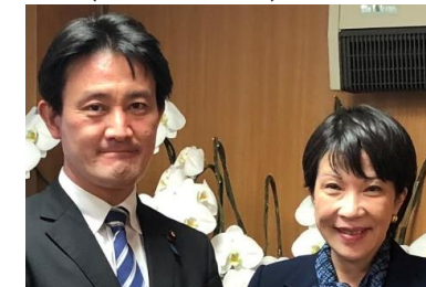
高市政調会長と経済対策！