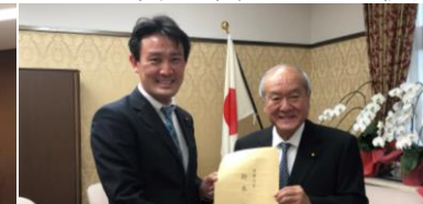
鈴木財務・金融担当大臣に政策を申し入れ