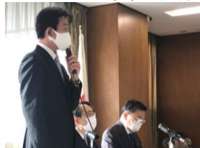
会議で方針を示す！