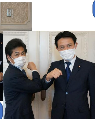
河野ワクチン接種担当大臣と 藤枝市・静岡県の面談実現