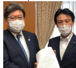
萩生田文科大臣に 学びの保証を提言