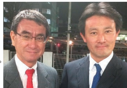
河野外務大臣と日本の外交を守り抜きます