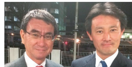
河野外務大臣と 日本の外交を守り抜きます