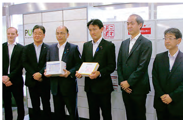
に 設 置 宅配ボックスを国土交通省