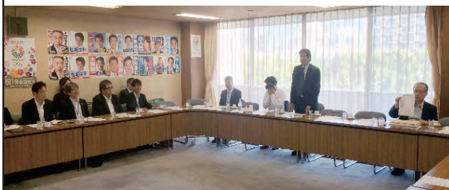
の 様 子 円卓会議初開催

宅配事業者・ドライバー任せではなく、みんなで協力して問題の解決を！これからも、働く人の目線も大事に取り組んで参ります。