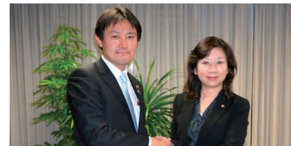
野田総務大臣・女性活躍 担当大臣と!