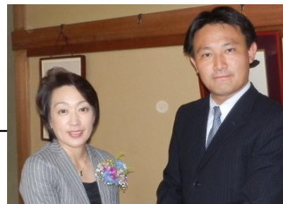
東京オリンピック・パラリンピック 成功へ！橋本参議院議員と 奮闘しています！