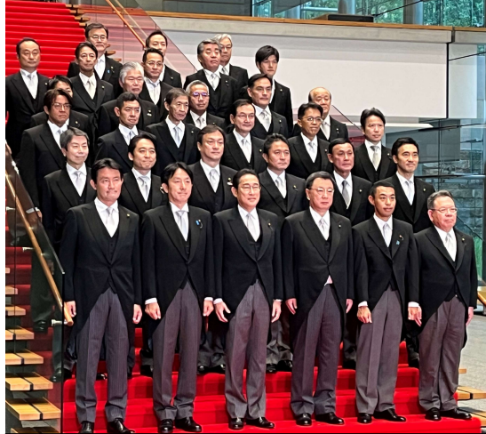
副大臣の集合写真。「残り30秒！」などと声が飛ぶほど分刻みスケジュール