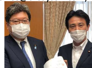
萩生田政務調査会長に 災害対策要請!