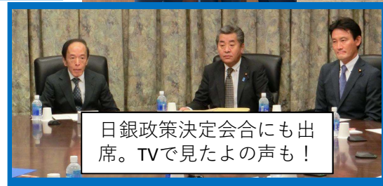
日銀政策決定会合にも出席。TVで見たよの声も！

日本銀行の植田総裁は牧之原市の出身であり、親近感を強く感じています。植田総裁率いる、日銀の独立を守りつつ、政府・日銀の政策連携が円滑に行くように努めて参ります。