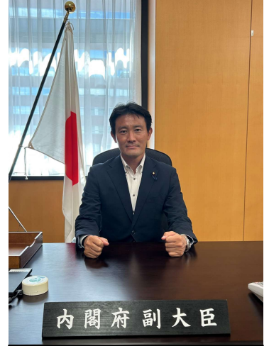
副大臣室が二つ！それだけ担当範囲が広い！