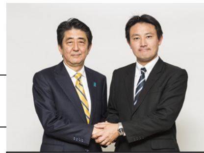
日本再生！安倍新総裁と誓いました。