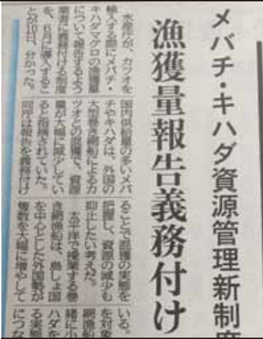
5月11日付け静岡新聞

カツオ漁業の際に、メバチ・キハダも一緒に捕ってしまう事が指摘されています。日本船は、それを避けるために努力をしていますが、漁業効率を高めるために、そうした努力をしていないと指摘を受けている国の船もあり、メバチ・キハダという私たちに親しみのある魚が減っています。水産資源を守るだけでなく、正直者がバカを見る社会には絶対にしない！今後も取り組んでまいります。