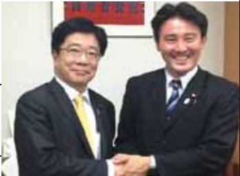
加藤一億担当相と政策実現に向けて結束！