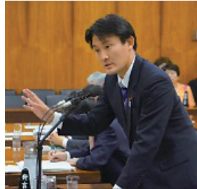
与党として前向きに鋭く！ 新人らしく誠実に確実に！

http://www.shugiintv.go.jp/jp/index.php?ex=VL&deli_id=42728&media_type=