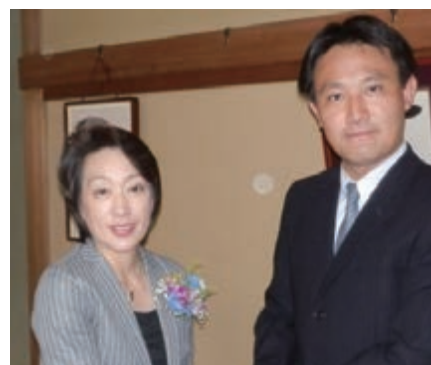
メダリスト橋本参議院議員と スポーツ振興・オリンピック誘致 奮闘しています!