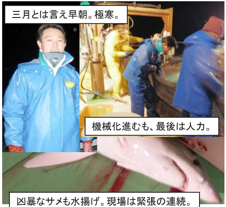
三月とは言え早朝。極寒。