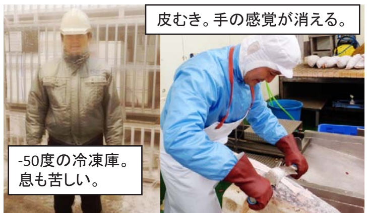
皮むき。手の感覚が消える。