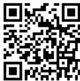
「いばやしブログ」配信中